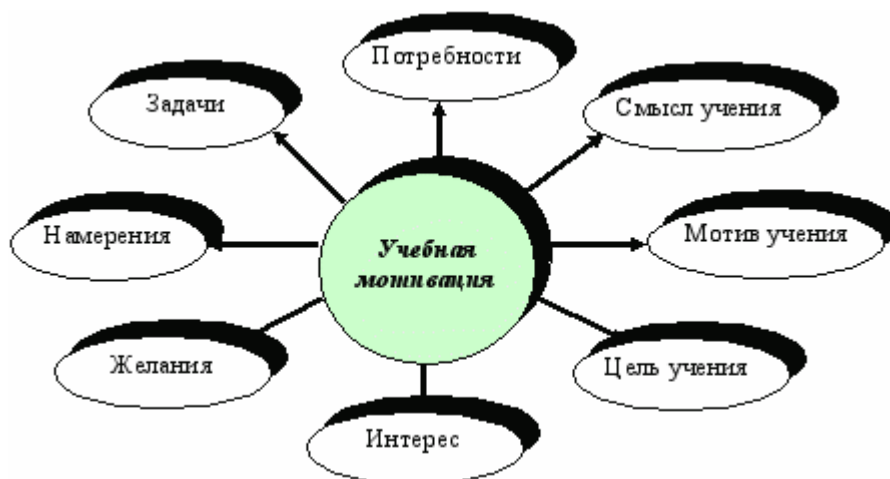
Рисунок 1. Общая структура учебной мотивации

Общую структуру учебной мотивации образуют потреб-ность, смысл учения, мотив учения, цель, интерес, желания и намерения, задача.